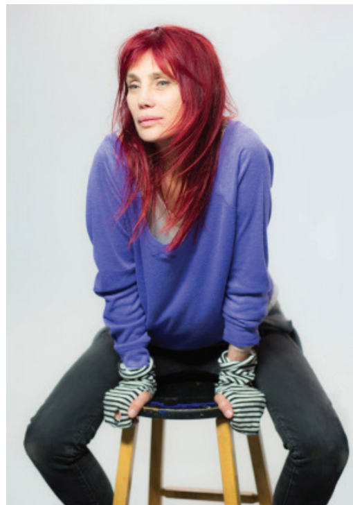
Chloé Sainte-Marie, chanteuse et actrice québécoise

à la Maison de la culture de Rivière-du-Loup Transport organisé par le CAPAB