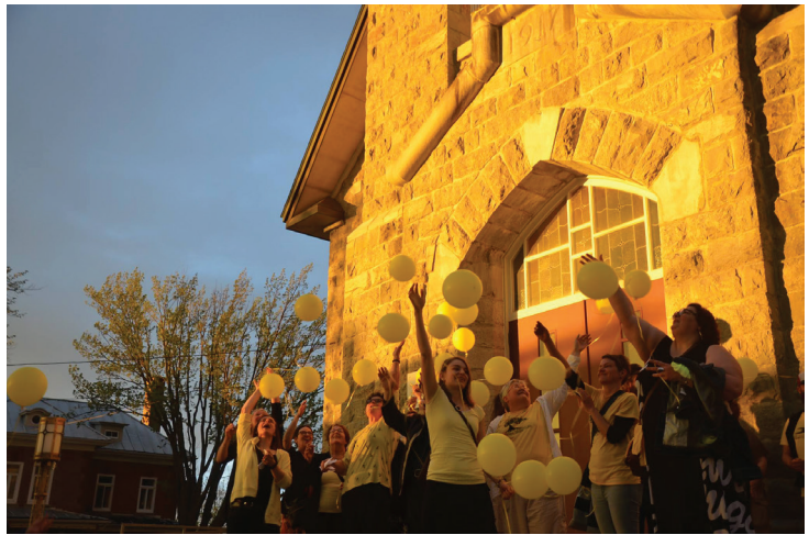
Journée Maillon du 1er juin 2018

L'approche citoyenne Maillon est née du besoin des intervenants des Basques de rejoindre leurs concitoyens très isolés. Une concertation autour de cet objectif s'est développée afin de mettre en place une approche citoyenne. Le Maillon, inspiré d'un modèle existant dans le milieu scolaire au Nouveau-Brunswick depuis près de 20 ans déjà, s'est taillé une place dans la MRC des Basques afin de répondre à toute personne qui a un besoin et qui souhaite obtenir de l'aide.